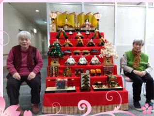
玄関前に飾られた7段飾り 昔を懐かしませていらっ しゃいました