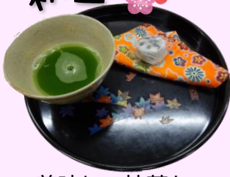
美味しい抹茶とお菓子でおもてなし