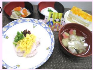
桜寿司 吉野汁 漬まぐろとろろかけ 里芋とがんもの含め煮 ケーキ