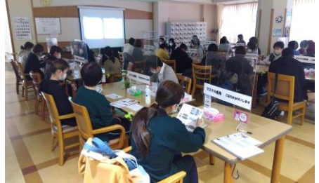
好日苑では職員の知識や技術の向上のため、 毎月内部研修を行っています。3月は「平穏 死を受け入れるレッスン&職業倫理」という テーマで老健看護師が担当をしました。