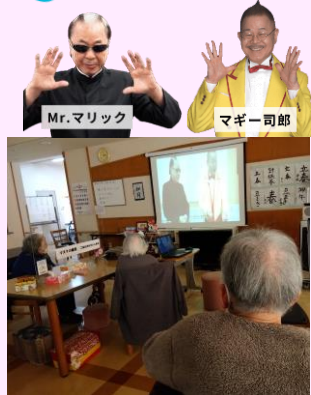
怖い鬼が登場 負けずに退治!