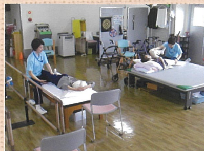
個別リハビリ風景

介護認定申請代行、在宅サービスの紹介やサービス提供事業所との連絡・調整、施設の紹介及び連絡・調整、ケアプランの作成、行政や医療機関等との連携、介護などの相談