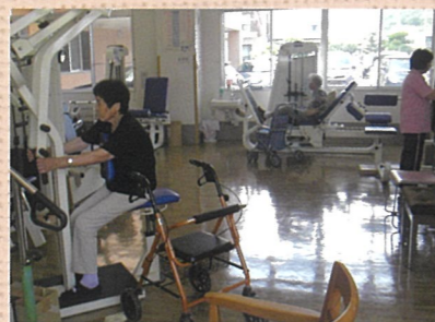
パワーリハビリテーション